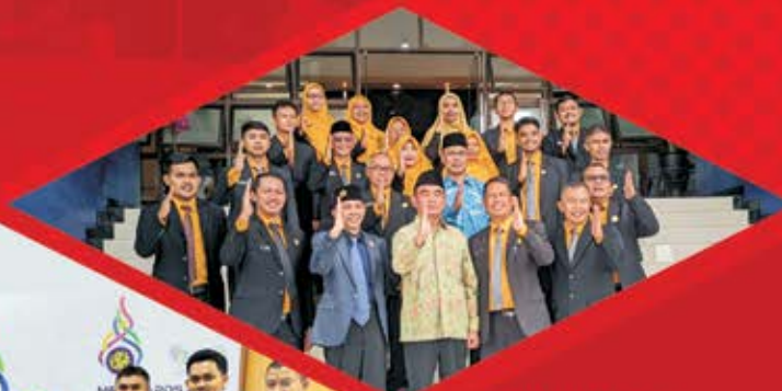
Kunjungan Prof. Muhadjir Effendy Penasehat Khusus Presiden Urusan Haji di SMK Muhammadiyah 7 Gondanglegi 2025