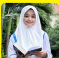
Sabah / SMPN 5 Kepanjen

"Bagus dan profesional. Sistemnya standar internasional. Menerapkan teknologi mutakhir dalam tata persuratan dan kearsipan. Guru-gurunya hebat dan telaten."