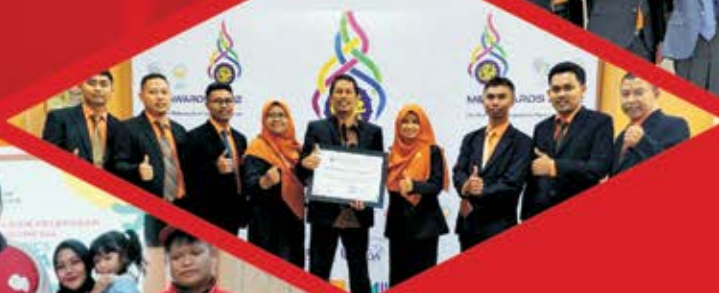
Juara Umum ME Award 2022