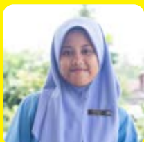
Elisiana / Malaysia

"Lab di SMK MUTU luar biasa. Luas, bersih dan rapi. Gedung dan ruangnya baru. Peralatannya baru, canggih dan mutakhir. Seperti di lab resmi saja."